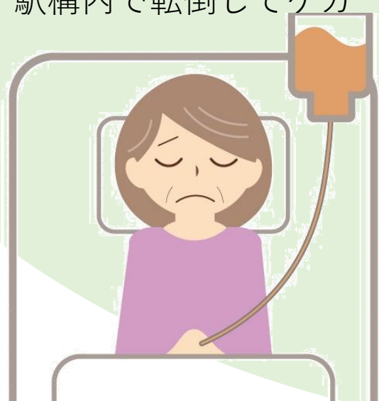
交通事故で所定の要介護状態になった

(注) 2023年4月1日より自転車利用者についてヘルメットの着用が努力義務となりました。