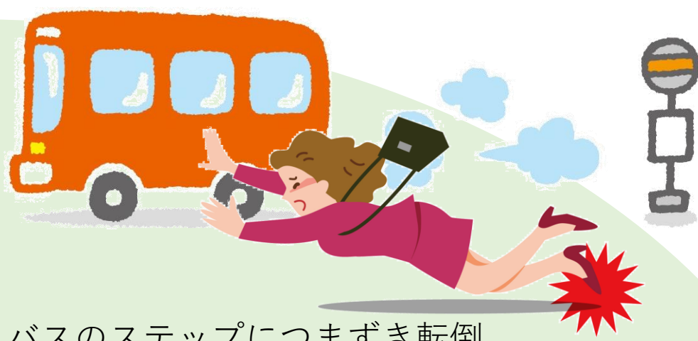
バスのステップにつまずき転倒