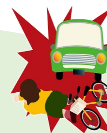
ひき逃げに遭い死亡

（注）2023年4月1日より自転車利用者についてヘルメットの着用が努力義務となりました。