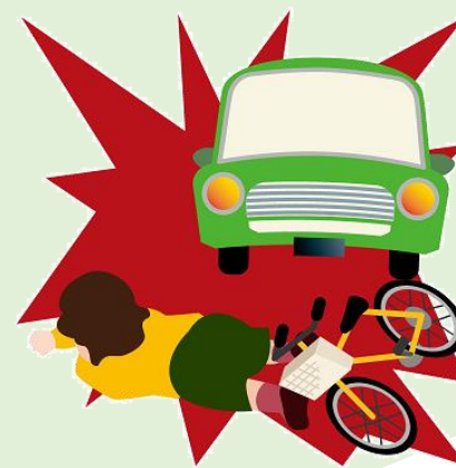
ひき逃げに遭い死亡