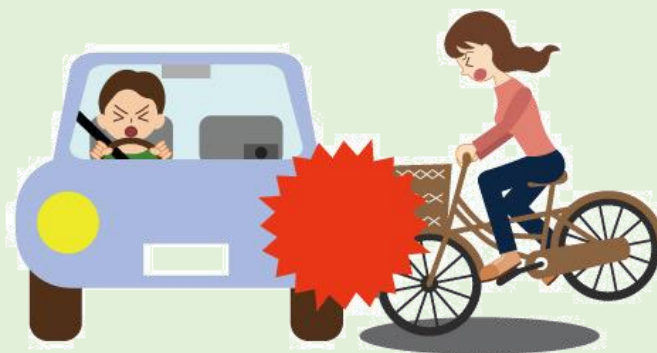
自転車に乗っていてケガ

(注) 2023年4月1日より自転車利用者についてヘルメットの着用が努力義務となりました。