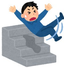
階段から落ちて死亡