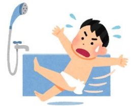
風呂場で転倒し死亡