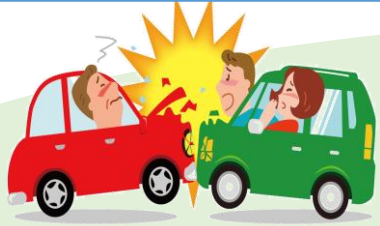
車同士で衝突してケガ