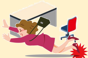
院内でつまずいてケガ