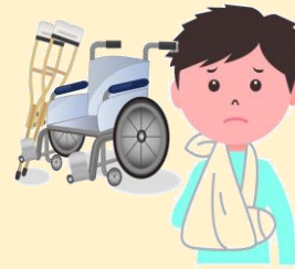
車椅子を押していて転倒