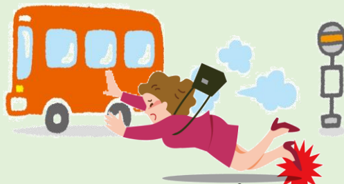
バスのステップにつまずき転倒