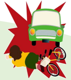
ひき逃げに遭い死亡

(注) 2023年4月1日より自転車利用者についてヘルメットの着用が努力義務となりました。