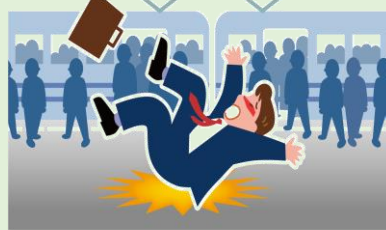
駅構内で転倒してケガ